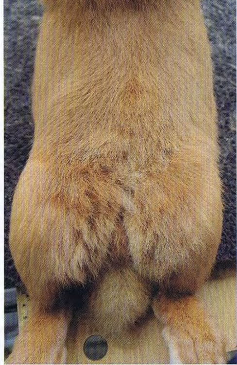
Deze buikkleur is al heel behoorlijk. Helemaal egaal tot aan de staartpunt is amper haalbaar.

doordat ze te weinig Y-factoren bij zich dragen. De rest van de jongen mag blijven zitten tot een leeftijd van 12 weken. Daarna selecteer ik op type, bouw en de voorbenen. Dat laatste, daar schort het bij mijn dieren nog wel eens aan.”