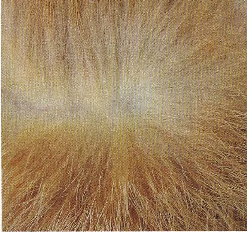
De oranje tussenkleur moet zo ver mogelijk doorlopen naar de wortel.