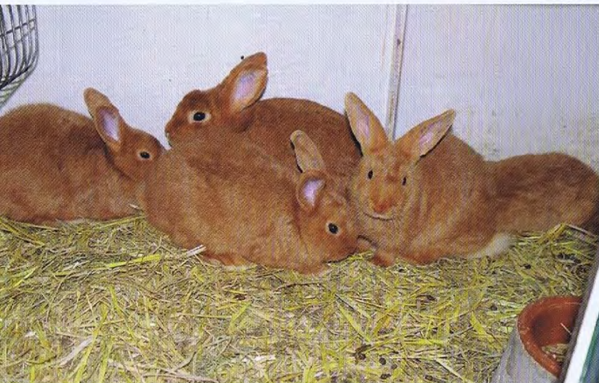
De heldere ruime verblijven bieden ruimte aan de voedsters met jongen.